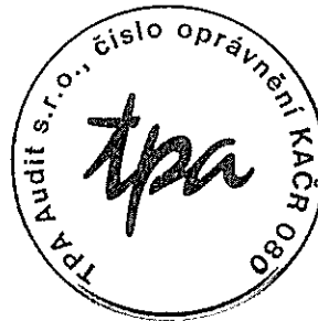
TPA Audit s.r.o. Antala Staška 2027/79, Praha 4 číslo oprávnění 080 KAČR